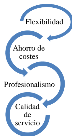
Dimensiones de Outsourcing