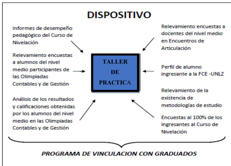
Esquema N° 1 (propio). Insumos para la construcción de Talleres de Práctica.

convicción que el docente enseña al alumno como adquirir el contenido a partir de sí mismo, del texto o de otras fuentes y a medida que él se vuelve capaz de adquirir ese contenido, aprende.