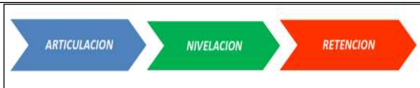
Esquema N° 1. Cadena de valor FCE