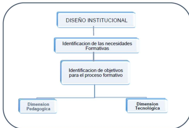
Figura 2. Etapas del Diseño Institucional.